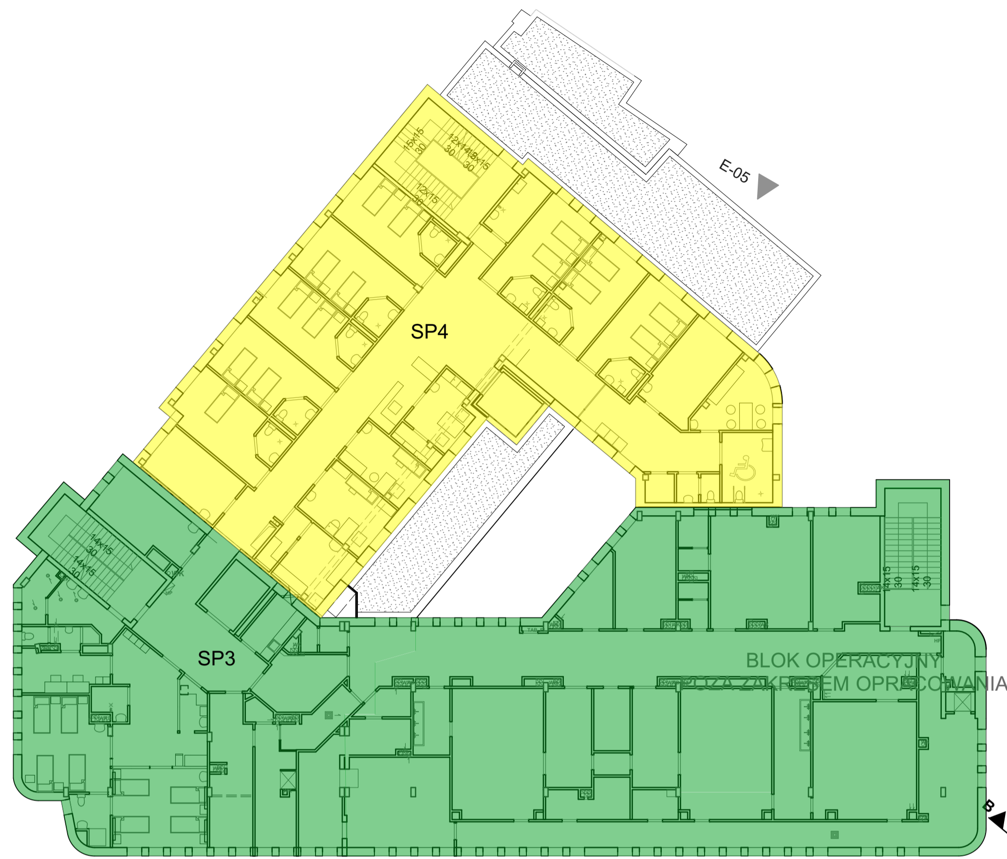
SCHEMAT STREF POŻAROWYCH