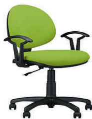
Krzesło biurowe - 3 szt SMART gtp27 ts02 +mechanizm CPT z kółkami do podłóży twardych NOWY STYL