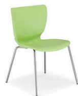
Krzesło kuchenne - 2 szt FIUGGI Chrome kolor PISTACHIO NOWY STYL