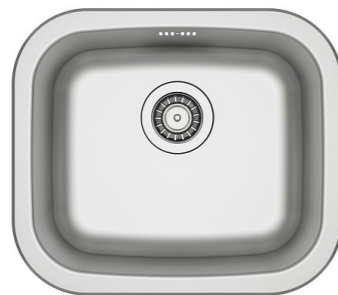
FYNDIG 45x39 Zlew 1-komorowy sta nierdzewna